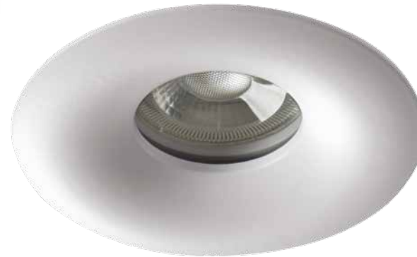
DROXY IP65 DSO-W 33125

Erhältlich in zwei matten Farben: weiß und schwarz.