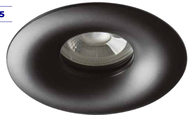
DROXY IP65 DSO-B 33126